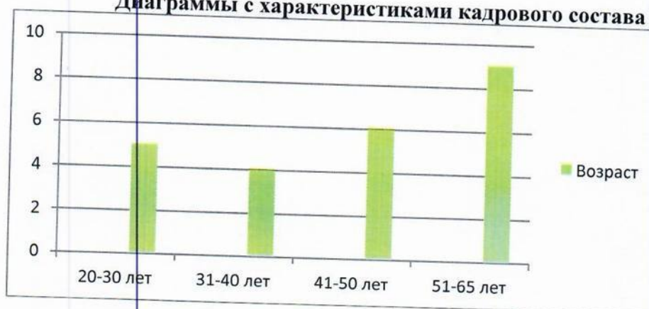
Диаграммы с характеристиками кадрового состава МБДОУ №18

Педагоги постоянно повышают свой профессиональный уровень, эффективно участвуют в работе методических объединений, знакомятся с опытом работы своих коллег и других дошкольных учреждений, а также саморазвиваются. Все это в комплексе дает хороший результат в организации педагогической деятельности и улучшении качества образования и воспитания дошкольников.